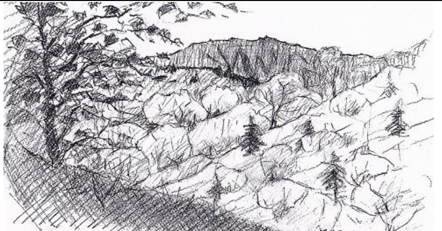
《安達太良山》 小竹 昇 佐野(日本水彩画会会員)